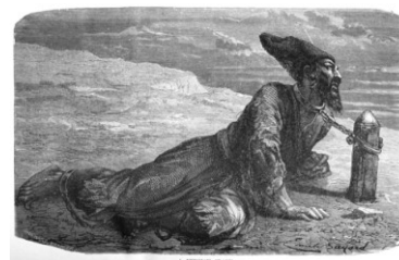
esclave perse à Khiva (XIX e s)

Khiva la rebelle était aussi un repère de pirates, de voleurs et surtout réputée pour son trafic d'esclaves qui ne prendra fin qu'en 1920 avec la victoire des russes. Les principales victimes de ces razzias étaient d'ailleurs souvent russes mais aussi iraniens. Les grands spécialistes de ce commerce étaient les actuels Turkmènes dont la frontière n'est qu'à quelques kms.